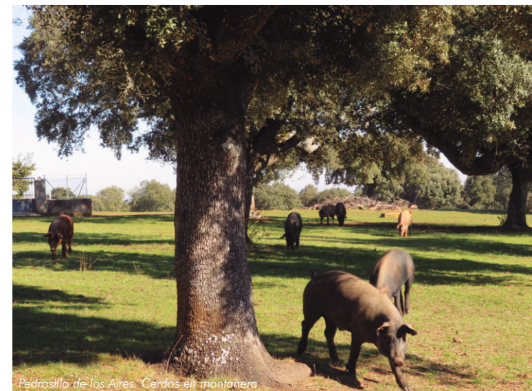
Pedrosillo de los Aires. Cerdos en montanera