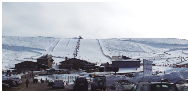
Estación de Esquí Sierra de Béjar

17,00 h.: Sesión de trabajo, visita a fábrica