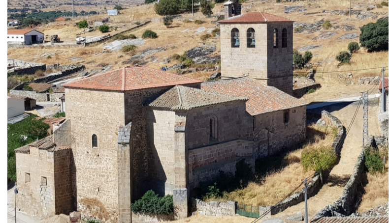
Puente del Congosto. Iglesia de Nuestra Señora de la Asunción

Mesa redonda: Turismo rural y despoblación